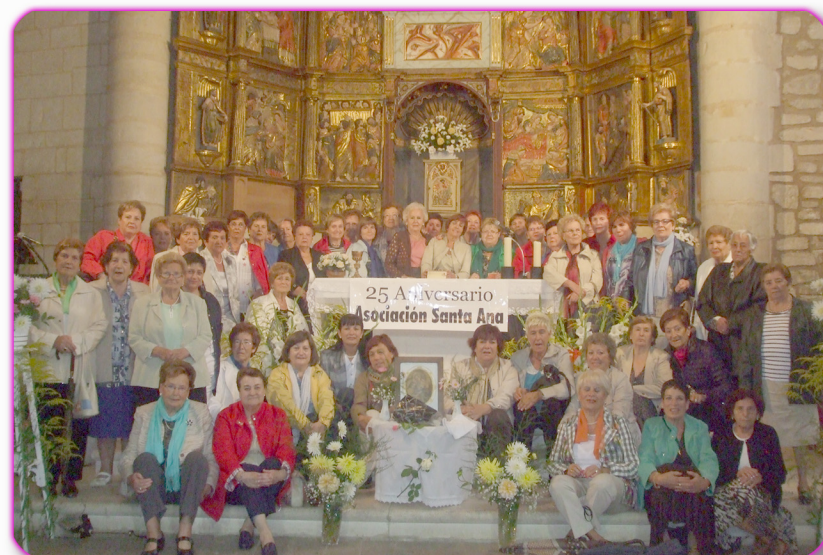
Visita de la Asociación Gizatiar a Salinas de Añana

Como ellas este año celebran el 25 aniversario de su fundación, una representación de Gizatiar asistió como invitada a la celebración del acontecimiento en Salinas.