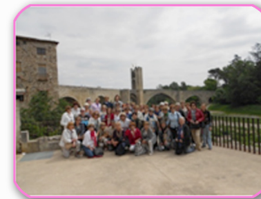
BESALU - Puente Románico

Han sido unos días intensos donde ha primado el buen ambiente y la camaradería.