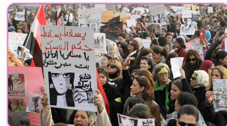
Mujeres egipcias protestan contra las actuaciones del Ejército a manifestantes en la Plaza Tahrir