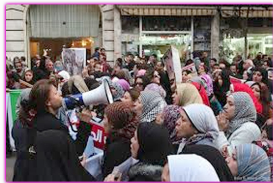
Mujeres tunecinas participando en una concentración

Desde Occidente presenciamos con cierta perplejidad las multitudinarias manifestaciones en Túnez, Egipto, Yemen, Libia... Por primera vez en la historia moderna, el pueblo árabe tomaba la calle y exigía que su voz fuera escuchada. Al grito de Khalas "¡basta ya!" los árabes recuperaban su dignidad. Enseguida empatizamos con quienes exigían libertades democráticas y cambios políticos, económicos y sociales.