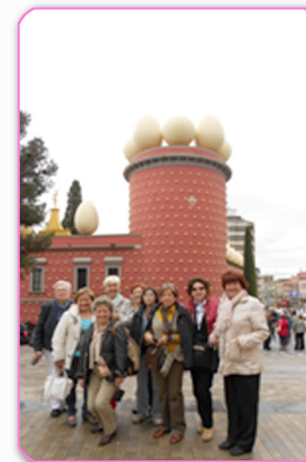
TEATRO MUSEO DALÍ