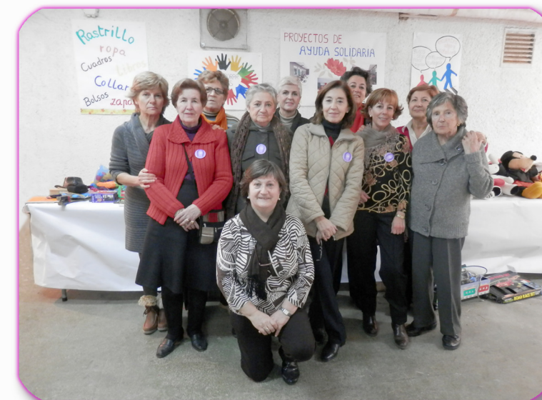
Comisión de Ayuda Solidaria

Los beneficios del Rastrillo y Caja Solidaria (organizado por la Comisión Ayuda Solidaria) generó unos fondos que se han destinado a diferentes proyectos como son: