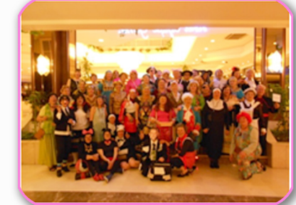
FIESTA DE DISFRACES

No podemos olvidarnos de las Salidas Culturales y Excursiones que hemos realizado durante el año, tales como las visitas a los Museos Arqueológicos, de Reproducciones y Guggenheim, así como las excursiones al Valle Salado de Añana y alrededores.