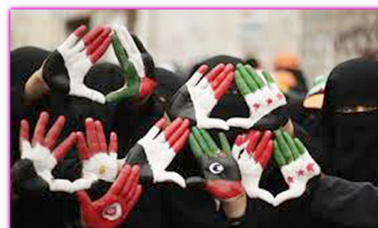
Mujeres yemeníes veladas haciendo el símbolo feminista