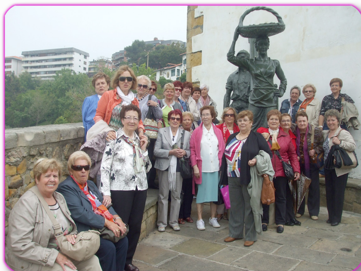
Invitación a la Asociación de Mujeres Santa Ana a visitar nuestro Municipio

La salida de este año a Salinas de Añana, resultó muy interesante y formativa.