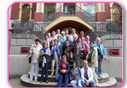
OLOT - Museo de los Volcanes