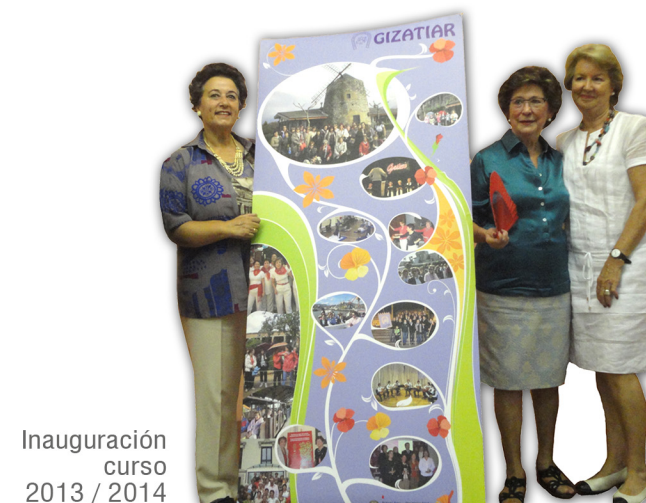
Inauguración curso 2013 / 2014