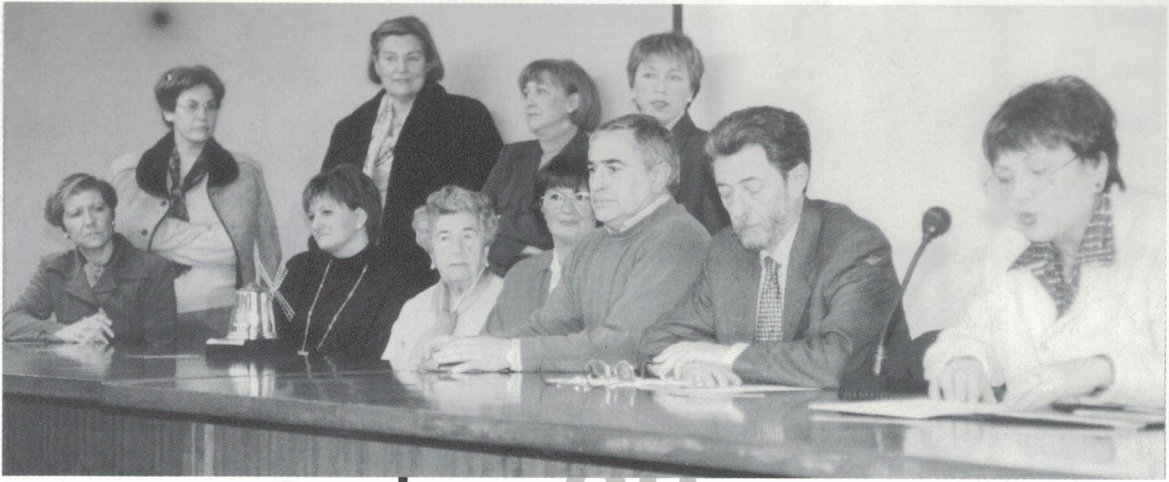
1998, Getxoko Boluntariotzaren Saria.