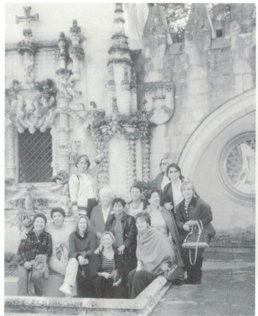
Viajes a Salamanca y a Portugal.

hemos salido a las calles el 8 de marzo, hemos recordado el 25 de noviembre a todas las mujeres que sufren la violencia, hemos ofrecido cursos y talleres, y nos hemos implicado en la realidad del Tercer Mundo. Y para que todo esto sea posible, es necesario el esfuerzo de un buen puñado de voluntarias comprometidas en su organización y su dinamización, y que son el alma del trabajo cotidiano de Gizatiar .