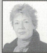
Voc. Instituc. Mª José Valverde