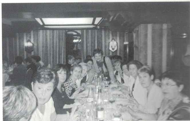
Eskuinean, Iruñako Emekumeen Elkartearekin topaketa. Goian, bazkideen bazkaria.

Arte, comunicación, feminismo, manualidades, salud, viajes, lucha por nuestros derechos y contra la violencia de género, política social, colaboración con entidades, nuevas tecnologías, música, teatro, voluntariado... el listado es largo, pero aún queda mucho por aprender, por hacer, por ofrecer.