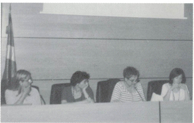
Coordinando la mesa de asociaciones socioculturales. Abajo, celebrando la Feria de Abril.