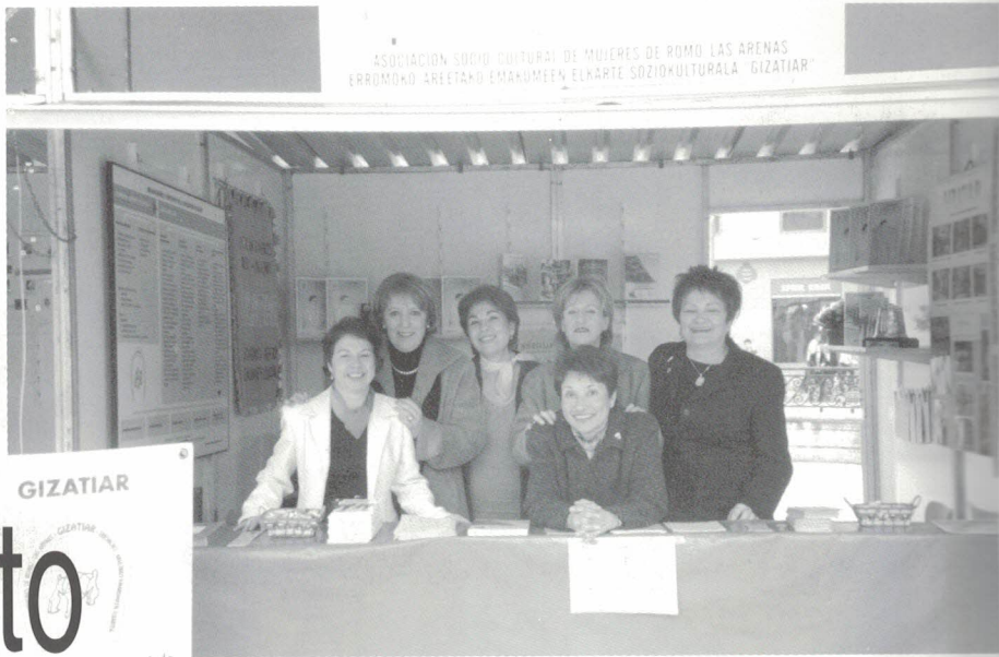
Feria de Asociaciones. Bilbao, 2003.

R elación, formación y solidaridad, éstas son las claves con las que Gizatiar enfrenta su quehacer asociativo. Cada una de ellas se despliega en toda una serie de variadas actividades gestionadas desde las diversas comisiones en que se organiza nuestra entidad. Año tras año desde aquel 1995, la asociación ha ido enriqueciendo el número y la variedad de sus propuestas, siempre pensando en las necesidades