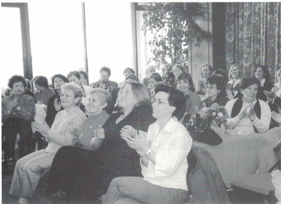
Club Marítimo del Abra. Entrega de diplomas de los cursos de informática.

Y como de costumbre, deciros que estamos a vuestra disposición para cuantas preguntas o sugerencias deseéis formularnos en todo momento.