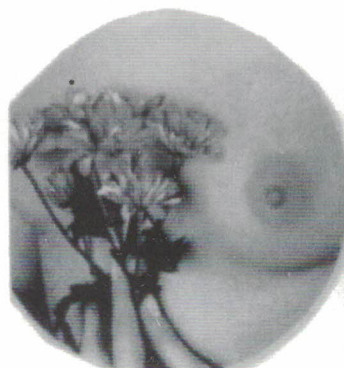
Cáncer de mama